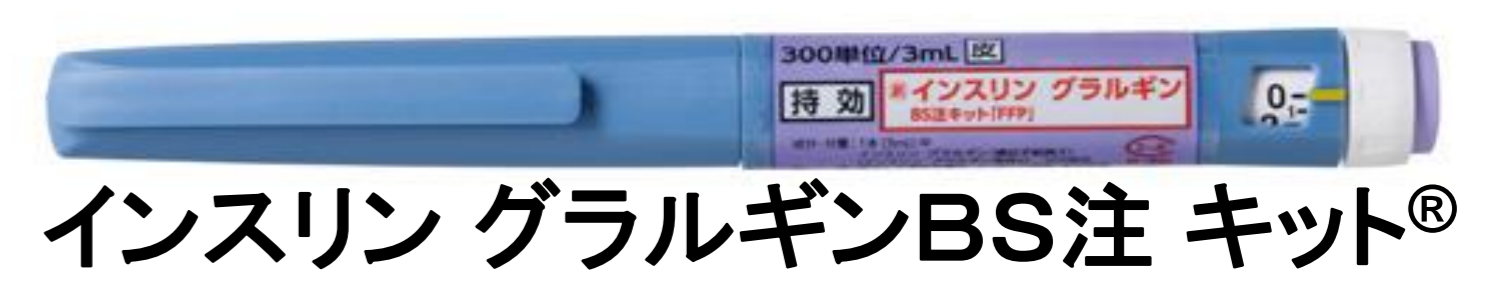
インスリン グラルギンBS注 キット®