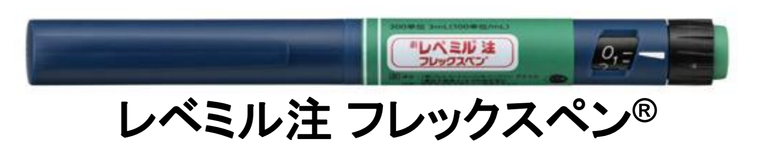
レベミル注 フレックスペン®