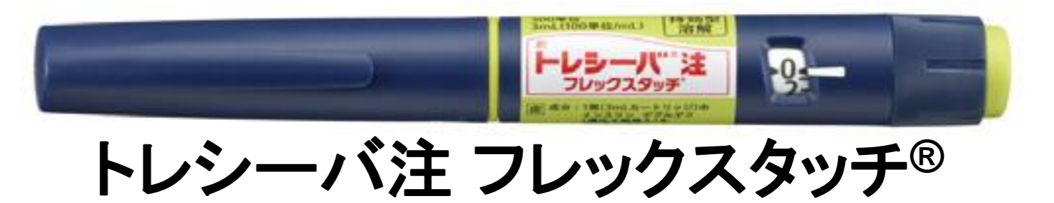
トリーバ注 フレックスタッチ®