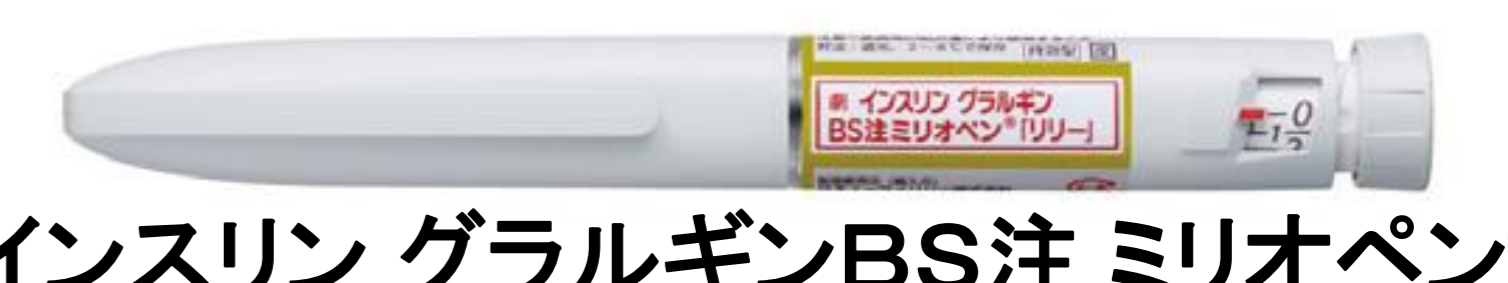
インスリン グラルギンBS注 ミリオペン®