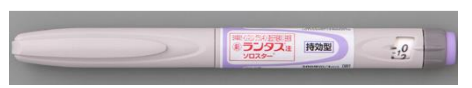
ランタス注 ソロスター®